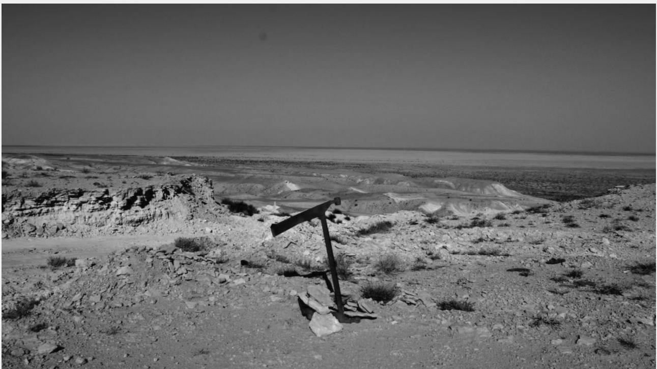
Marker 2: Der Aralsee 2011 vom Boden betrachtet und im ISS-Video von 2016. Tippe auf das Bild, um den aktuellen ISS-Überflug über den Aralsee mitzuerleben.