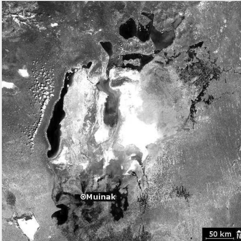
Marker 3: Satellitenbild aus dem Jahr 2017 (Sentinel), AR: Uferlinien des Aralsees von 2000 bis 2016

Tippe in der App auf das Bild, um die Uferlinienanzeige zu starten, tippe nochmals, um sie zu pausieren. Zur Orientierung: Oben rechts befindet sich die Jahreszahl.